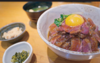
牛さガリのステーキ丼 1200円、増肉 1.5倍 600円、トッピング卵 100円

当コーナーは日々のストレスを筋トレで発散させ、かつ理想のボディを手に入れようという目標を本誌記者が有効な筋トレと筋力増強グルメを紹介する。毎度おなじみ南体育館にてインストラクターの助言をもらいつつ、今回は『モットマシヨブルゴッコ』をおこなっていく。肩甲骨の上方回旋、下方回旋の動きを中心とし、広背筋に刺激を与える。やり方はバーを握って胸に向かって下ろすだけ。一見簡単で初心者にも手を出しやすいのだが、一つ間違えれば広背筋に刺激が届かず効果が薄れてしまう。ここでは特筆して2つの注意点を紹介する。1つ目は上体の倒しすぎだ。より大きな重量を上げようとやりがちな