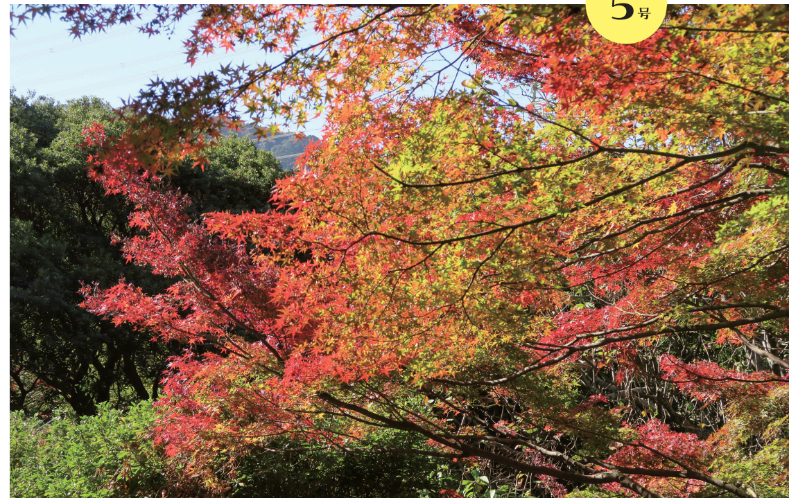
花畑園芸公園の紅葉