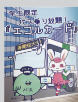
地元企業とのコラボ。学生がデザインしたチラシ。

今年8月、南市民センターで開催された「文化の夏まつり」。このイベントには、区内にある大学・短大の学生がボランティアとして参加していた。南区では区内の7大学・短大との間で包括連携協定を締結し、各校の専門分野を活かしたさまざまな活動を展開している。