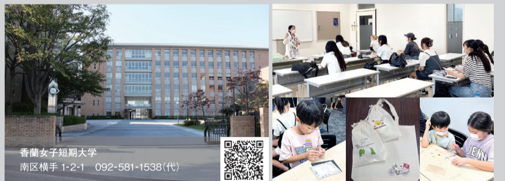
香蘭女子短期大学 南区横手 1-2-1 092-581-1538(代)