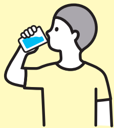
水分補給 給水スポットや自動販売機が あるところもあります