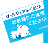
クールシェア スポットの 目印です

コロナ禍の影響で 2019 年を最後に中断していたクールシェアふくおかを今年から再開することになりました。福岡市は一般に開放された場所で、暑さをしのぎ涼しく快適に過ごすことができる施設クールシェアスポットを広く募集し、2024 年は複合商業施設や公民館など、424 箇所（2024 年 6 月現在）を対象施設として実施します。