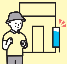
クールシェアスポット のぼりやステッカーが 目印です

気温が高くなる夏の暑い時期に、商業施設や公共施設などの涼しく過ごせる施設（クールシェアスポット）を利用することで熱中症予防及び省エネの促進につながる取り組みです。