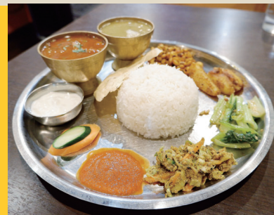
ビナヤカスペシャル ¥1,200 + ギー(澄ましバター) ¥100