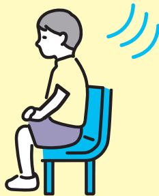
休憩いす 涼しい部屋で体調を 整えることができます